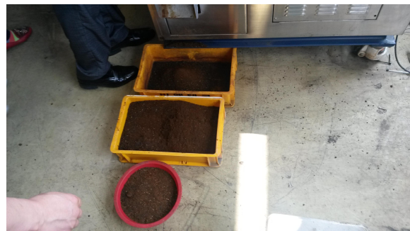
처리과정을 거친 부산물을 퇴비 또는 연료로 사용