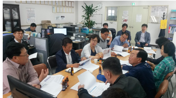
제조사 대표의 감량기 제품 설명