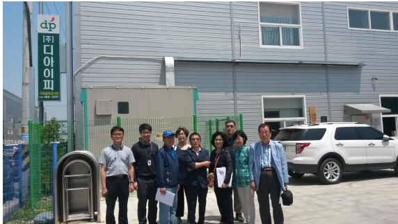
음식물 쓰레기 감량기 제조회사 방문