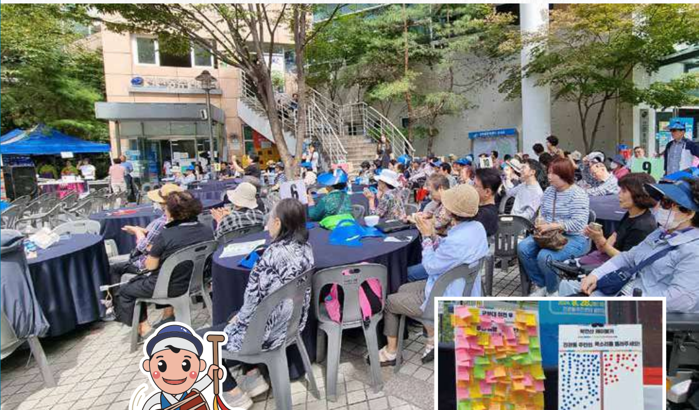
진관동 마을캐릭터 파발꾼 진관이