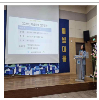
총회 결과 발표 사진

이상과 같이 수색동 제5회 주민총회 결과를 주민 여러분께 알려드립니다. 주민총회 결과에 대한 문의 및 의견 제시는 수색동 주민자치회(02-351-0394)로 연락주시기 바랍니다.