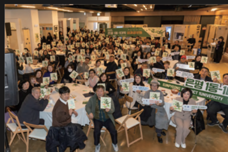
〈1동 1대학 성과공유회〉