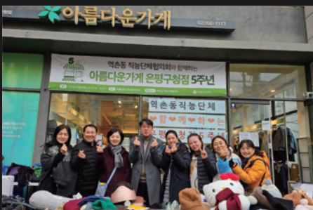
〈아름다운 가게 바자회〉