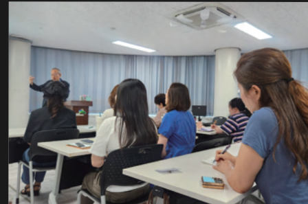
〈1동 1대학 수업〉