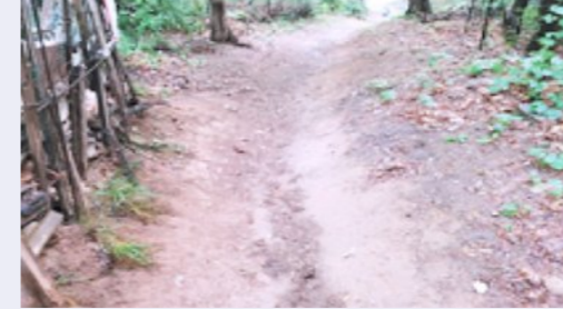
수국사 주변정리 전

수국사 일대 산책로에 야자매트 및 벤치 설치 등 산책로를 정비하여 주민들의 안전하고 쾌적한 봉산이용 및 관광지로서의 가치를 제고 함.