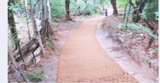
수국사 주변정리 후